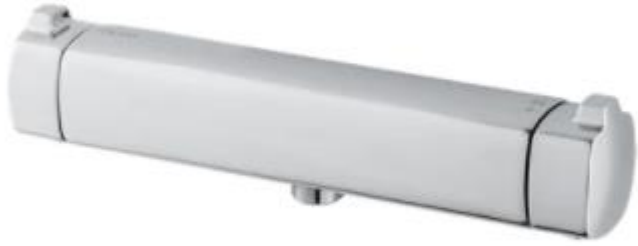
SUIHKUSETTI FAIR JET DAMIXA